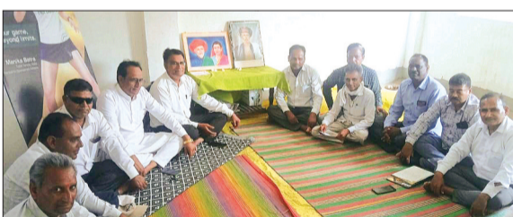
आयोजन समिति की बैठक संपन्न